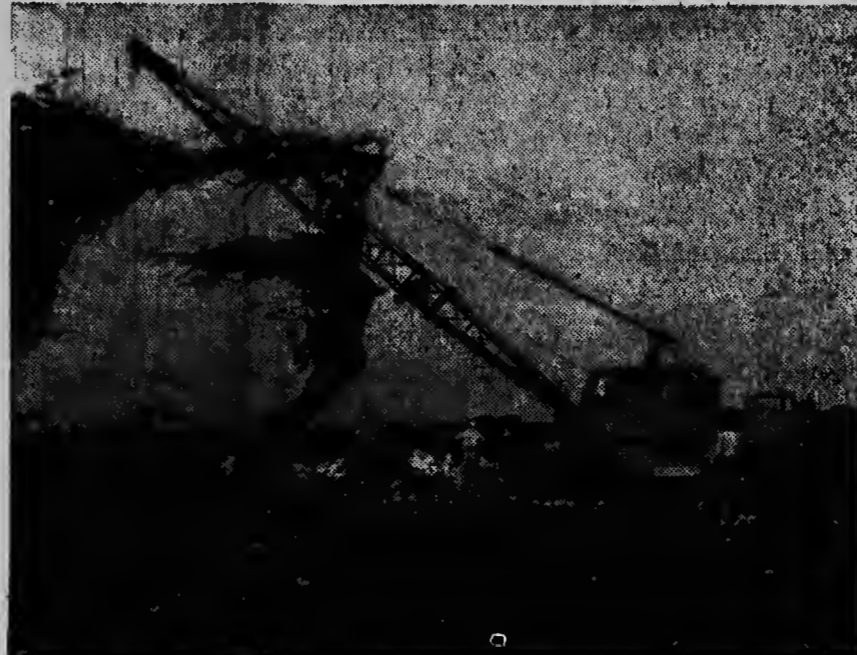
Soms gebeurt het op Balashi wel eens, dat een buldozer zich tussen de hopen stenen vastwerkt. Dan moet er, zoals de foto laat zien, zwaar materiaal aan te pas komen om de zaak weer even te „fixen“.